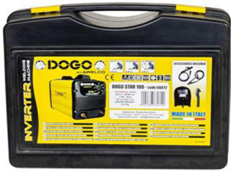
INV.MMA DOGOSTAR 100-BAG - EU

Il posto di saldatura dogostar 100 rilascia una potenza di 80 ampere e è dotato di ultima generazione inverter. Ideale per saldare con bacchette di elettrodi di 1.6 A diametro 2.5 mm. Dispone di un microprocessore di un alto livello, evita il collage di l' elettrodo e garantisce un buon avvio. Il modulo è progettato per la saldatura di lamiere senza problemi, Spessori fino a 3 mm. Un sistema di ventilazione e di protezione termostatico è disponibile per lavorare in tutta sicurezza. Può essere collegato a un gruppo elettrogeno di 2.4 KVA. I cavi Pinza di massa, cavo porta elettrodo, maschera di saldatura e il martello spazzola sono forniti con la borsa di trasporto. Questo dispositivo è realizzato in Italia e Garantito 2 Anni.<br/> Peso 4.3 Kg Garanzia 2 Anni standard/classificazioni Certificazione CE standard/classificazioni en 60974 - 1 Corrente di saldatura 5 - 80 A Tensione alimentazione U1 monofase - 230 V 50/60Hz Diametro elettrodo 1.6 A 2.5 mm Classe di protezione IP 21S - Fattore di funzionamento 80 A 25% potenza assorbita 1.6 KVA Tensione a vuoto 60 V